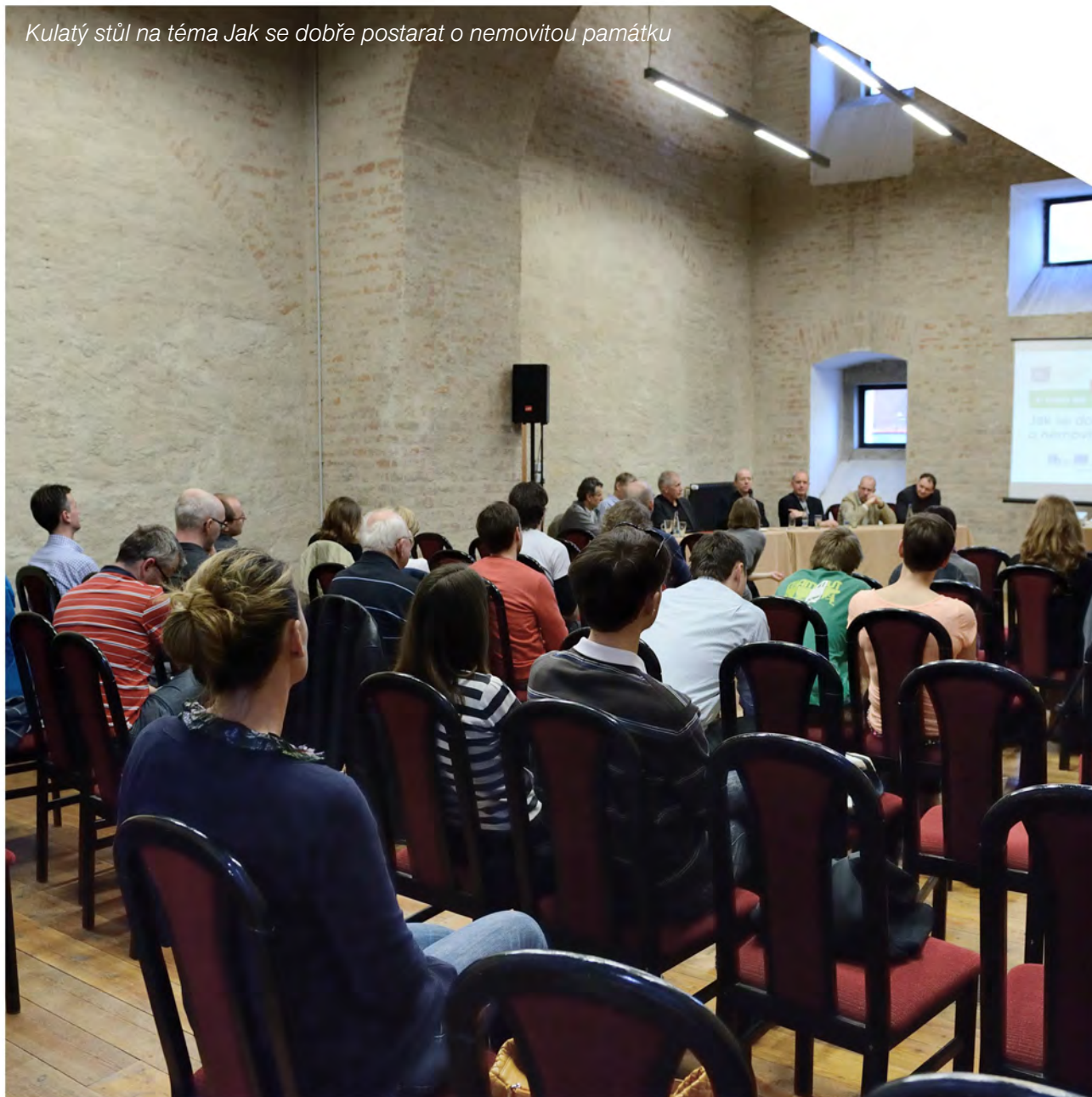
Kulatý stůl na téma Jak se dobře postarat o nemovitou památku