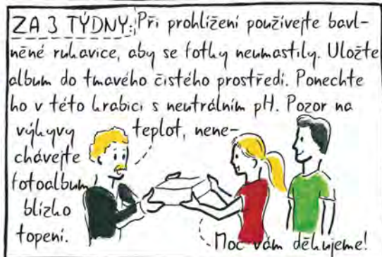
Ukázka z komiksu Jak být dobrý majitel movité památky